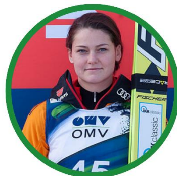
カリーナ・フォークト