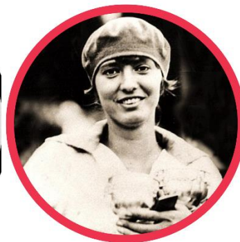
ハリナ・コノパッカ

オーストリア、1924 年 冬季オリンピックで女子シ ングルスフィギュアスケート 競技で金メダルを獲得した 最初の女性