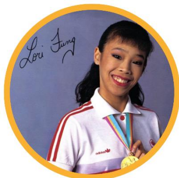
ローリ・ファン・ メトホルスト

ポーランド、1928 年 円盤投げで金メダルを獲 得し、ポーランドに初めて 金メダルをもたらした 最初の女性